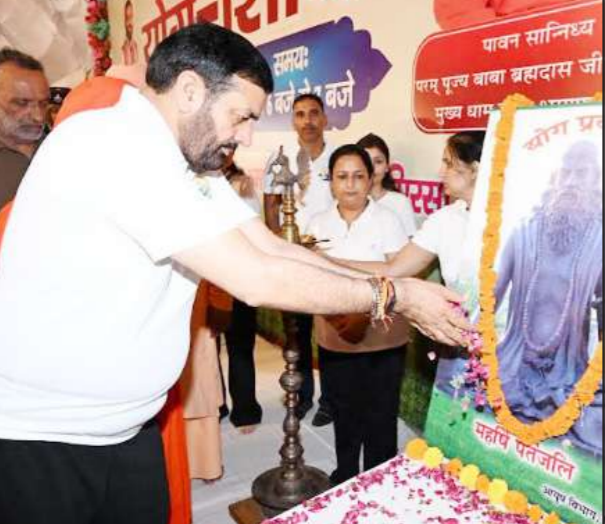
ਹਰਿਆਣਾ ਦੇ ਮੁੱਖ ਮੰਤਰੀ ਸ਼੍ਰੀ ਨਾਇਬ ਸਿੰਘ ਸੈਣੀ ਜ਼ਿਲ੍ਹਾ ਸਿਰਸਾ ਦੇ ਪਿੰਡ ਭੂਮਣਸ਼ਾਹ ਵਿੱਚ ਸਥਿਤ ਮੁੱਖ ਧਾਮ ਬਾਬਾ ਭੂਮਣਸ਼ਾਹ (ਸੰਗਰ ਸਰਿਸਤਾ) ਵਿਖੇ ਆਯੋਜਿਤ ਯੋਗ ਕੈਂਪ ਦੌਰਾਨ ਮੁੱਖ ਸੰਬੋਧਨ ਮਹਾਰਿਸ਼ੀ ਪਤੰਜਲੀ ਦੀ ਤਸਵੀਰ 'ਤੇ ਭੁੱਲ ਭੇਟ ਕਰਦੇ ਹੋਏ।