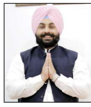
ਸ਼੍ਰੀ ਅਨੰਦਪੁਰ ਸਾਹਿਬ, 19 ਜੂਨ - ਸ਼. ਅ. ਬਿਓਰ-

ਉਨ੍ਹਾਂ ਕਿਹਾ ਕਿ ਉਹ ਆਪਣੇ ਆਪ ਨੂੰ ਬਹੁਤ ਭਾਗਾਂ ਵਾਲਾ ਸਮਝਦੇ ਹਨ ਕਿ ਉਨ੍ਹਾਂ ਨੂੰ ਇਸ ਮਹਾਨ ਪਵਿੱਤਰ ਧਰਤੀ ਦੀ ਸੇਵਾ ਕਰਨ ਦਾ ਮੌਕਾ ਮਿਲਿਆ ਹੈ। ਉਨ੍ਹਾਂ ਕਿਹਾ ਕਿ ਇਸ ਧਰਤੀ ਦੀ ਸੇਵਾ ਕਰਨਾ ਦੁਨੀਆ ਦਾ ਸਭ ਤੋਂ ਵੱਡਾ ਅਤੇ ਵਡਮੁੱਲਾ ਕਾਰਜ ਹੈ ਅਤੇ ਉਹ ਆਪਣਾ ਹਰ ਸਾਹ ਇਸ ਧਰਤੀ ਦੀ ਸੇਵਾ ਲਈ ਸਮਰਪਿਤ ਸਮਝਦੇ ਹਨ। ਕੋਬਨਿਟ ਮੰਤਰੀ ਨੇ ਦੱਸਿਆ ਕਿ ਪਿਛਲੇ ਚਾਰ ਸਾਲਾਂ ਦੌਰਾਨ ਸ੍ਰੀ ਅਨੰਦਪੁਰ ਸਾਹਿਬ ਦੇ ਸਰਬਪੱਖੀ ਵਿਕਾਸ ਲਈ ਅਣਖੋਂ ਯਤਨ ਕੀਤੇ ਗਏ ਹਨ। ਸਭ ਤੋਂ ਪਹਿਲਾਂ 3 ਕਰੋੜ ਰੁਪਏ ਦੀ ਲਾਗਤ ਨਾਲ ਸ਼ਹਿਰ ਦੇ ਦਾਖਲੇ 'ਤੇ ਸਥਿਤ ਪੰਜ ਪਿਆਰਾ ਪਾਰਕ ਦਾ ਨਵੀਨੀਕਰਨ ਕਰਵਾਇਆ ਗਿਆ, ਜੋ ਪਿਛਲੀਆਂ ਸਰਕਾਰਾਂ ਦੀ ਅਣਦੇਖੀ ਦਾ ਸ਼ਿਕਾਰ ਹੋ ਚੁੱਕਾ ਸੀ ਅਤੇ ਅੱਜ ਸੰਗਤਾਂ ਤੇ ਸ਼ਹਿਰ ਵਾਸੀਆਂ ਲਈ ਖਿੱਚ ਦਾ ਕੇਂਦਰ ਬਣ ਚੁੱਕਾ ਹੈ। ਉਨ੍ਹਾਂ ਕਿਹਾ ਕਿ ਮਹਾਨ ਸਿੱਖ ਜਰਨੈਲ ਅਤੇ ਰੋਗਰੋਟੇ ਗੁਰੂ ਕਾ ਬੇਟਾ ਦਾ ਵਰ ਪ੍ਰਾਪਤ ਭਾਈ ਜੀਵਨ ਸਿੰਘ ਜੀ (ਭਾਈ ਜੀਤਾ ਜੀ) ਦੀ ਸ਼ਾਹੀ ਸੰਗਤ ਨੂੰ ਸਮਰਪਿਤ ਕਰੋੜਾਂ ਰੁਪਏ ਦੀ ਲਾਗਤ ਨਾਲ ਆਧੁਨਿਕ ਭਾਈ ਜੀਤਾ ਜੀ ਯਾਦਗਾਰੀ ਅਜਾਇਬ ਘਰ ਦਾ ਨਿਰਮਾਣ ਕਰਵਾਇਆ ਗਿਆ ਹੈ, ਜਿੱਥੇ ਉਨ੍ਹਾਂ ਦੇ ਜੀਵਨ ਅਤੇ ਕੁਰਬਾਨੀ ਨੂੰ ਆਧੁਨਿਕ ਤਕਨੀਕ ਰਾਹੀਂ ਦਰਸਾਇਆ ਗਿਆ ਹੈ। ਉਨ੍ਹਾਂ ਕਿਹਾ ਕਿ ਰੋਜ਼ਾਨਾ ਸੰਗਤਾਂ ਇਹ ਅਜਾਇਬ ਘਰ ਦੇਖਣ ਲਈ ਪਹੁੰਚਦੀਆਂ ਹਨ ਤੇ ਵੱਡਮੁੱਲੇ ਇਤਿਹਾਸ ਤੋਂ ਜਾਣੂੰ ਹੁੰਦੀਆਂ ਹਨ।